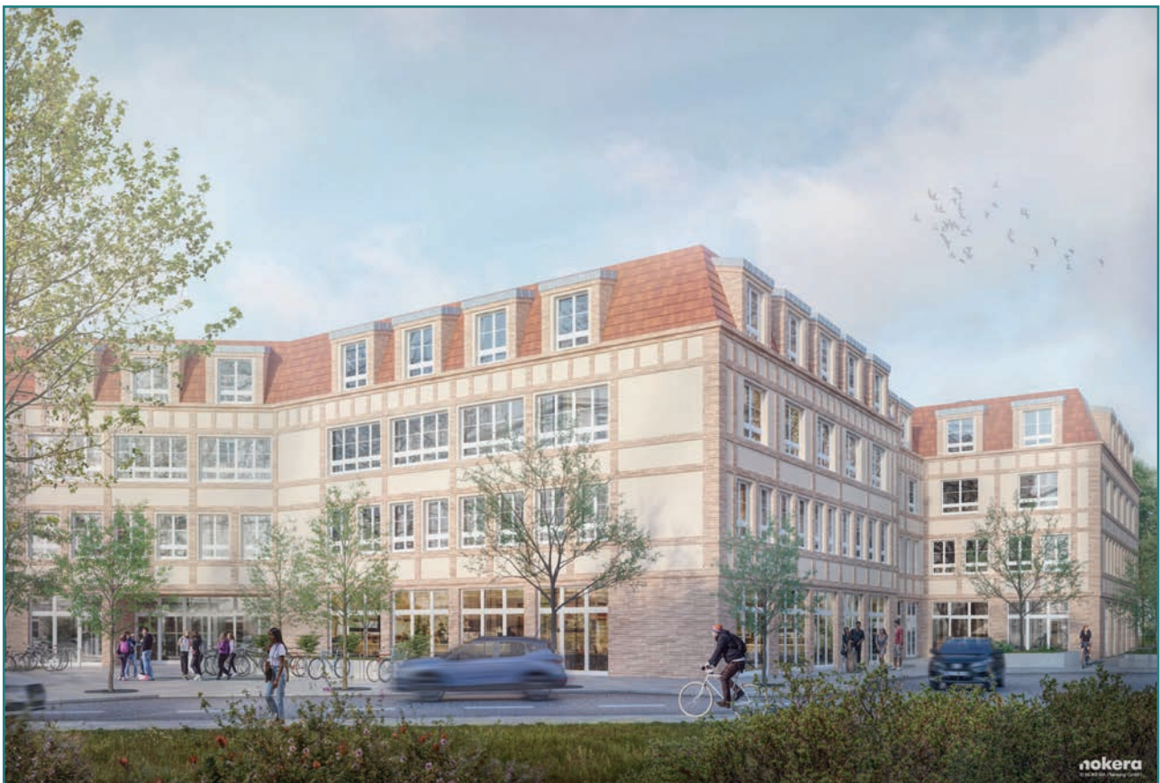
Visualisierung des Schulgebäudes

Verschiedene Kursangebote entstehen in einem Aushandlungsprozess zwischen Kind, Lernbegleiter*in und Eltern. Um einen Überblick über die individuellen Lernerfolge und den Stand in verschiedenen Bereichen bekommen gibt es „ Sprechende Wände “, an denen täglich der aktuelle Stand der Projekte durch Kinder und Lernbegleiter*innen festgehalten wird und die zur Selbstreflexion beitragen.